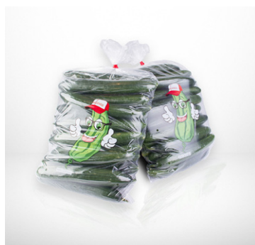
Worek 5 kg