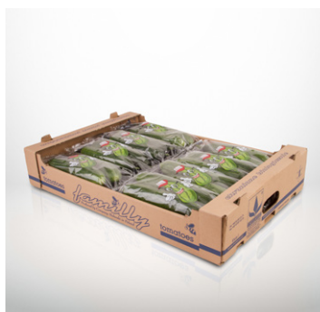
Karton 5 kg