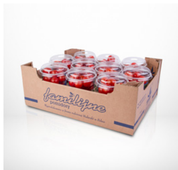
шейкер 250 г "Сладкие Кусочки"