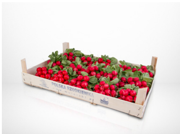
Фанера 20 пучков